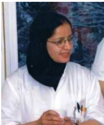
نوشته ای از دکتر خاتول فروتن

استفاده الکل به شکل مشروبات الکلی از زمانه های خیلی قدیم در اکثر نقاط جهان مروج بوده است. تاریخ نویسان در این مورد نظریات گوناگونی دارند اولین الکلی که مورد استفاده انسان قرار گرفته از انگورهای وحشی و یا توت ها و عسل تهیه می گردید که به اسم شهد آب یا Mead مسمی شده بود. استفاده این نوع الکل قدامت تاریخی زیادی داشته و در کشور های مثل هندوستان، افریقای جنوبی، چین و مصر مروج بوده است.