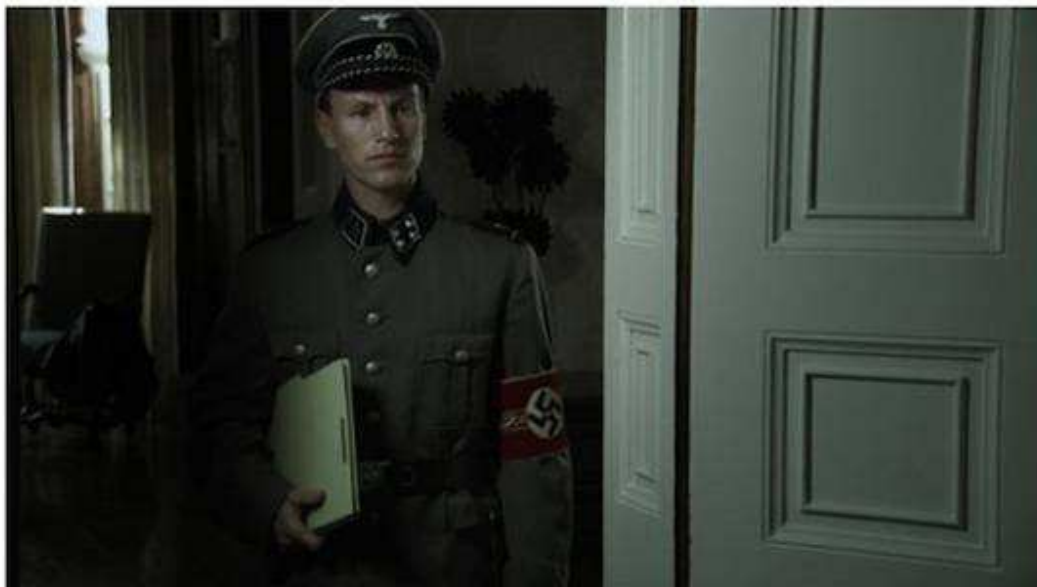
THE CANDIDATE (DER KANDIDAT) by Yosef Baraki

Category: Montreal World Film Festival Published on 29 August 2013 Written by VIMOOZ.com