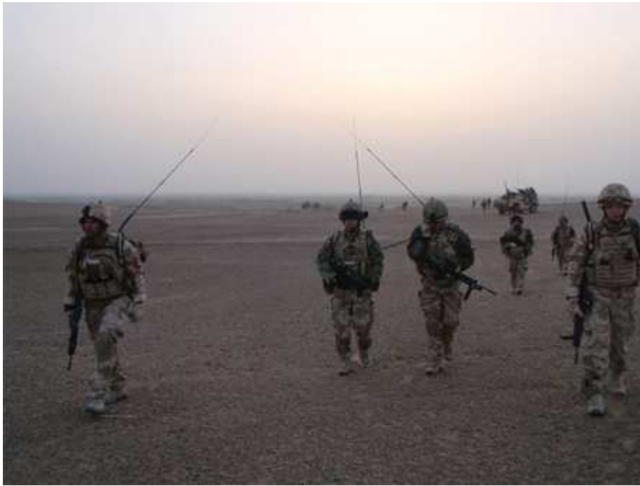
عساکر انگ لیسی در هلمند

خرد و عقل و فراست بمن حکم میکند تا شرط جوان مردان کابل را رسماً اعلان نمایم و با صراحت بنویسم که گرچه سنگ صبوریم اما کاسه صبر جوانان کابل سرازیر شد و باید عاقلانه اندیشید و فرجام کار را دید و از خود پرسید که با بغداد شدن کابل کی برنده خواهد بود؟