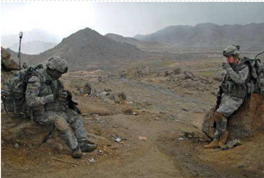
عساکر امریکایی در زابل