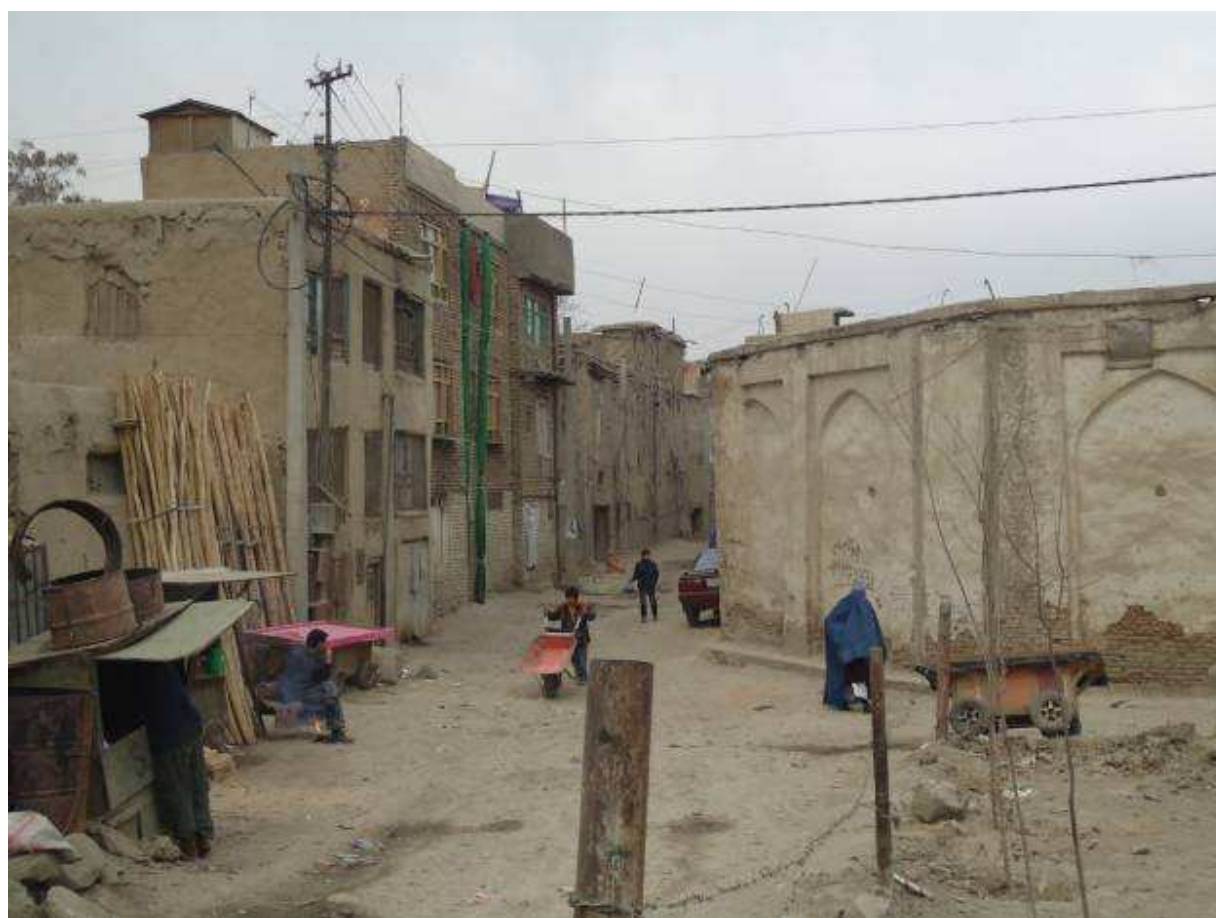
زیارت و مسجد بابای خودی در کابل قدیم. سال 1390