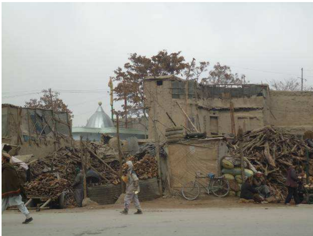
زیارت در آنطرف سرای چوب فروشی دیده میشود. گذر بابای خودی.