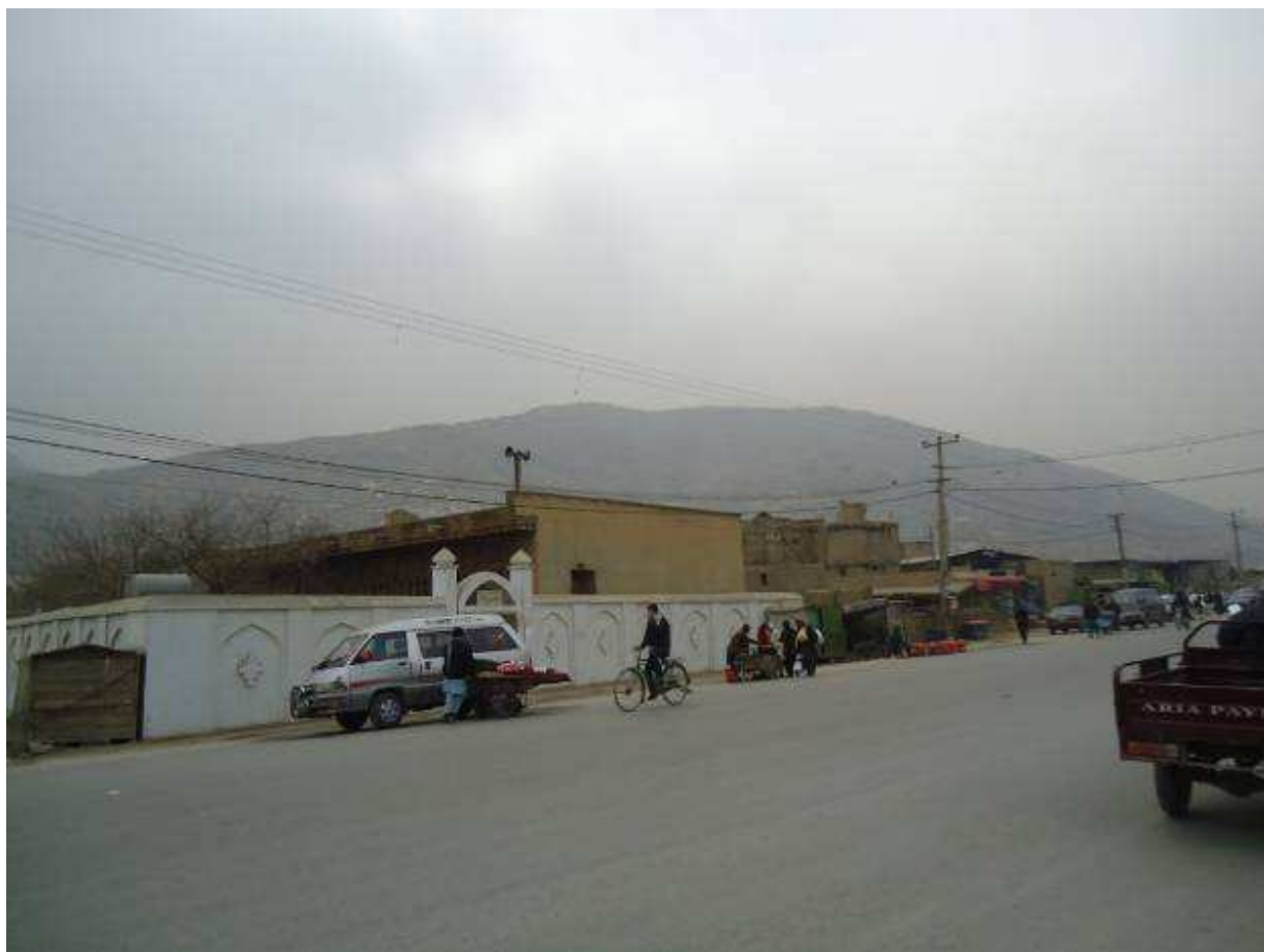
مسجد ملا محمود یا مسجد پدری دکتور عبد الرحمن محمودی فقید در گذر بابای خودی که در مقابل معبد یا درمسال واقع شده است.