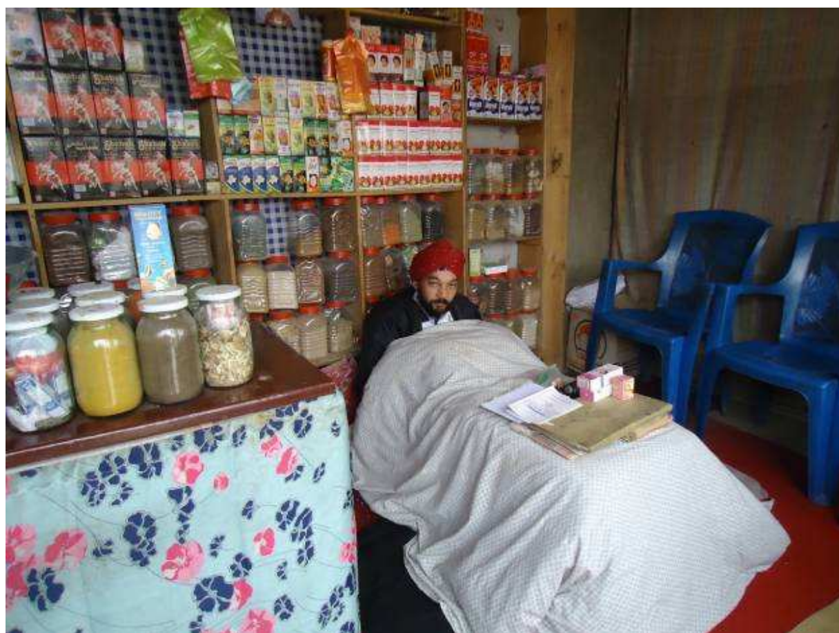
سردار و مغازه عطاری اش در گذر بابای خودی یا کاتبیل قدیم.