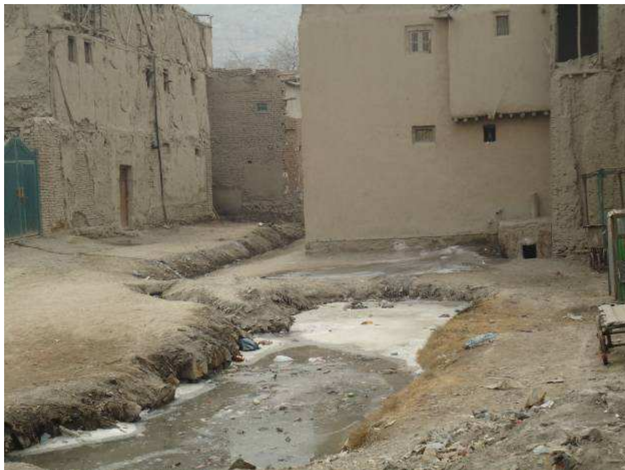
گذر بابای خودی در سال 1390 حمل