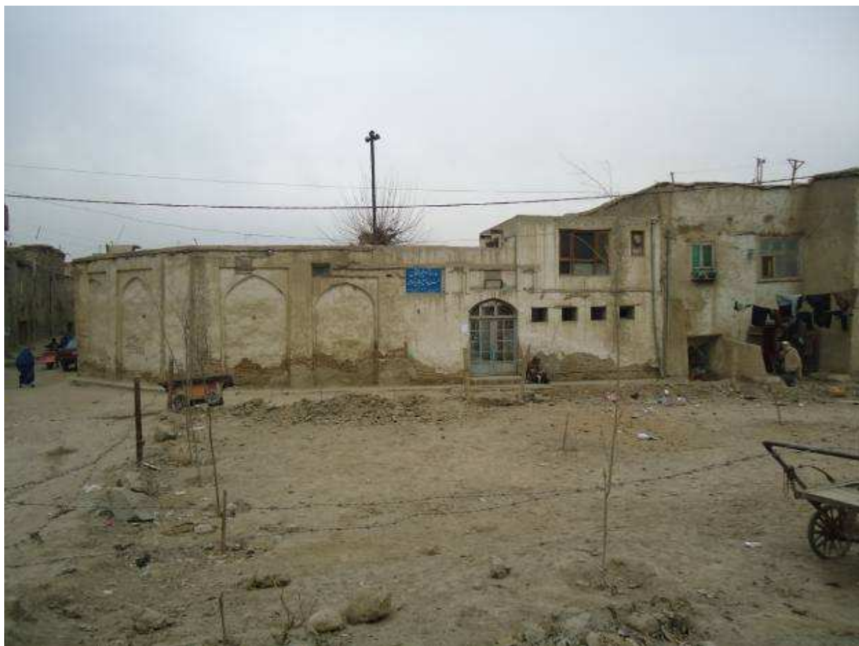
مسجد جامع بابای خودی در کابل. سال 1390