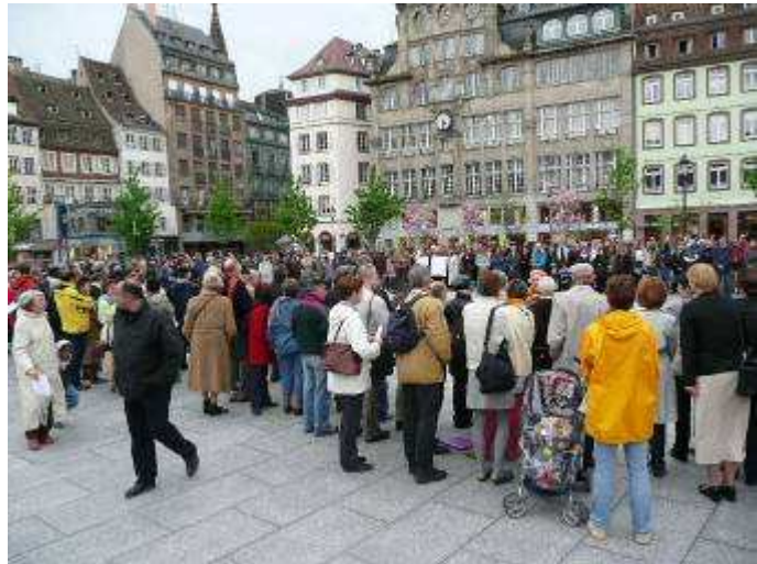
دایره سکوت در شهر استراسبورگ - فرانسه